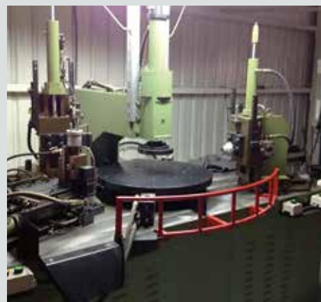
Spinnmaschine für den Metalleinsatz der King-Size Dichtung